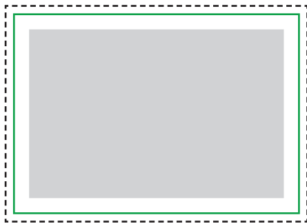
1:1 Vorlage auf Seite 2